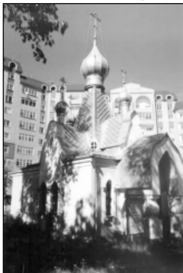
музея - «Путешествие Пушкина по дороге Петербург Москва».

Этот дом - городская усадьба, где семья Олениних проживала до самой революции. Не случайны жители города избрали местом создания музея дом, который и поныне хранит светлый образ пушкинской музы. Экспозиция