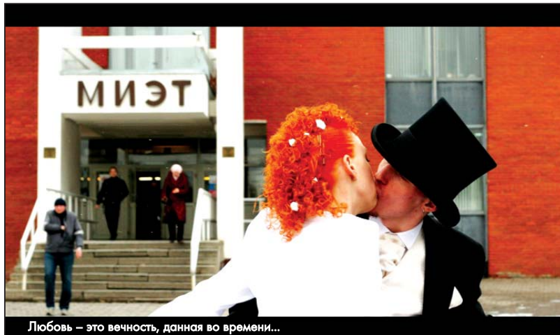
Любовь – это вечность, данная во времени...

По ту сторону объектива: Ксения Эйдельман